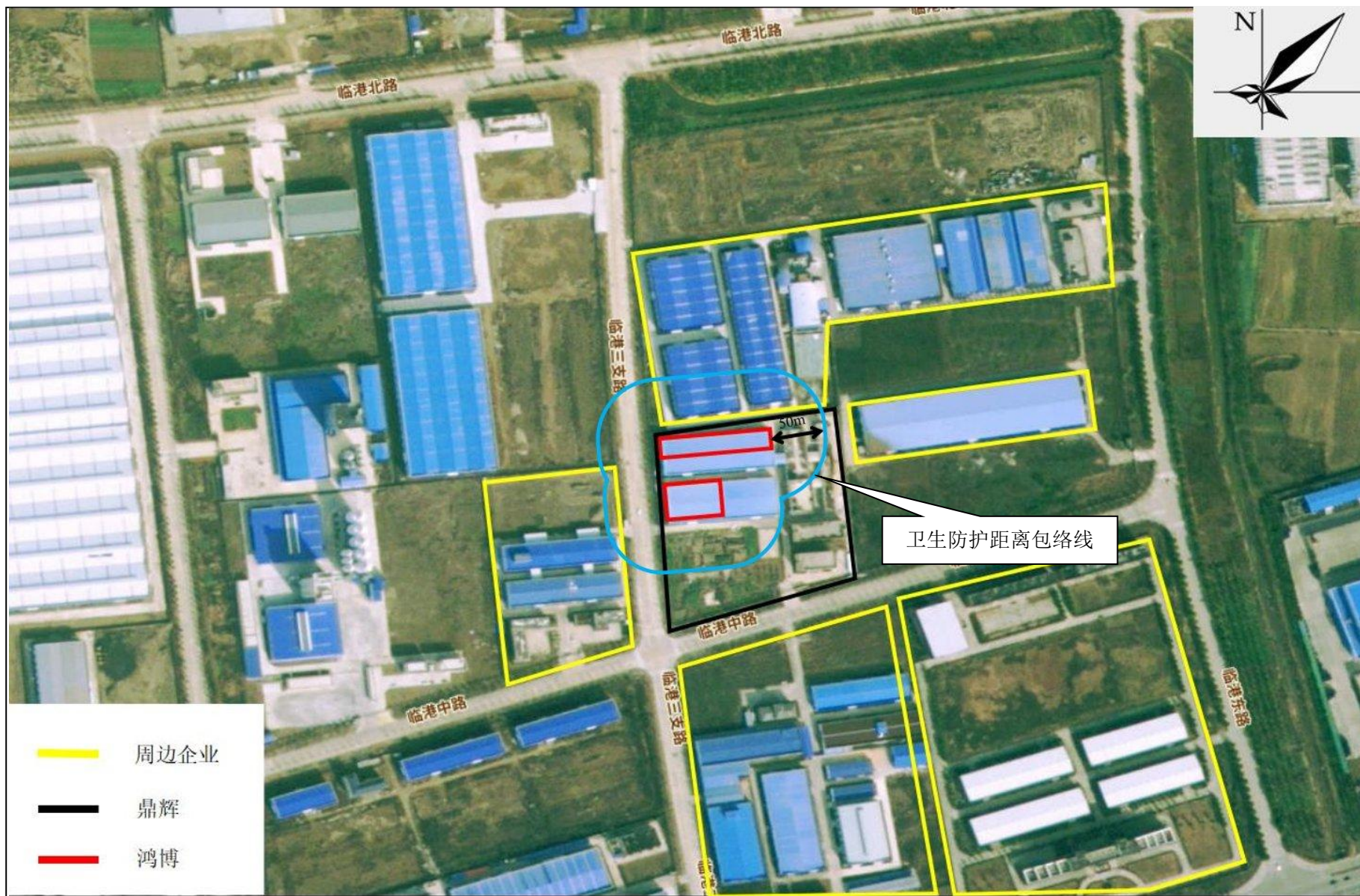
附图5 项目卫生防护距离包络线图