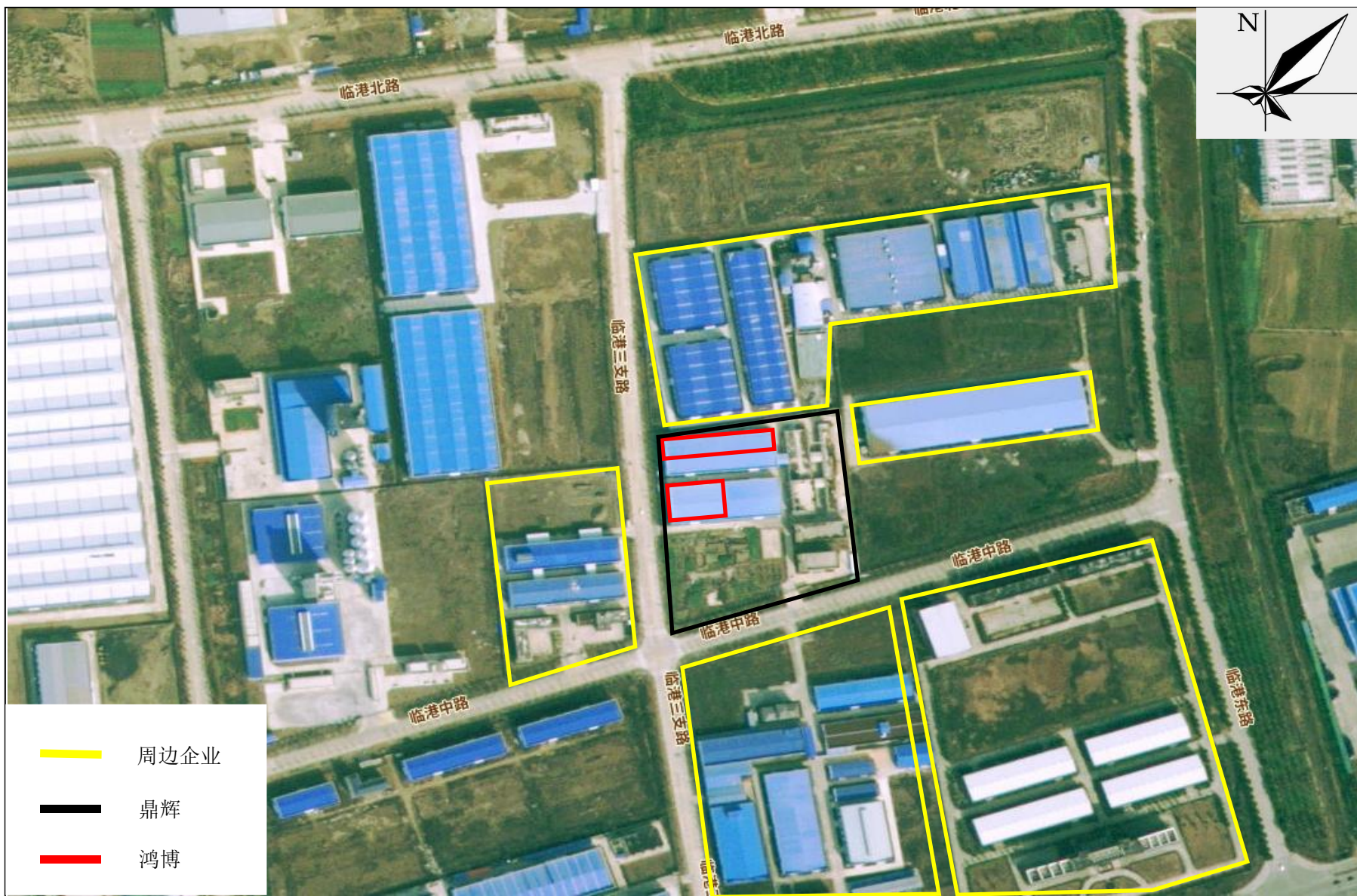
附图 2 项目周边关系示意图