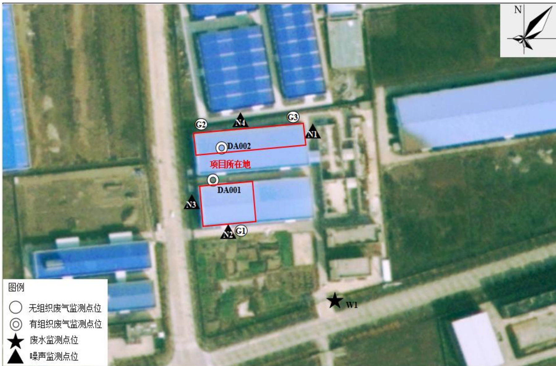
附图 4 项目监测点位图